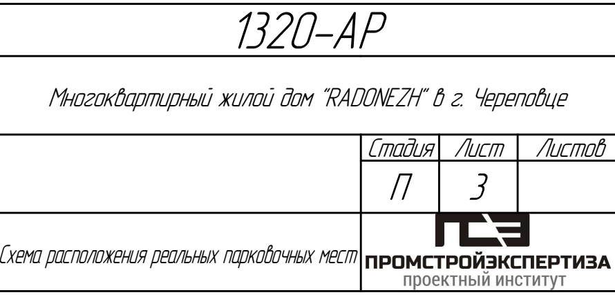
Схема расположения реальных парковочных мест